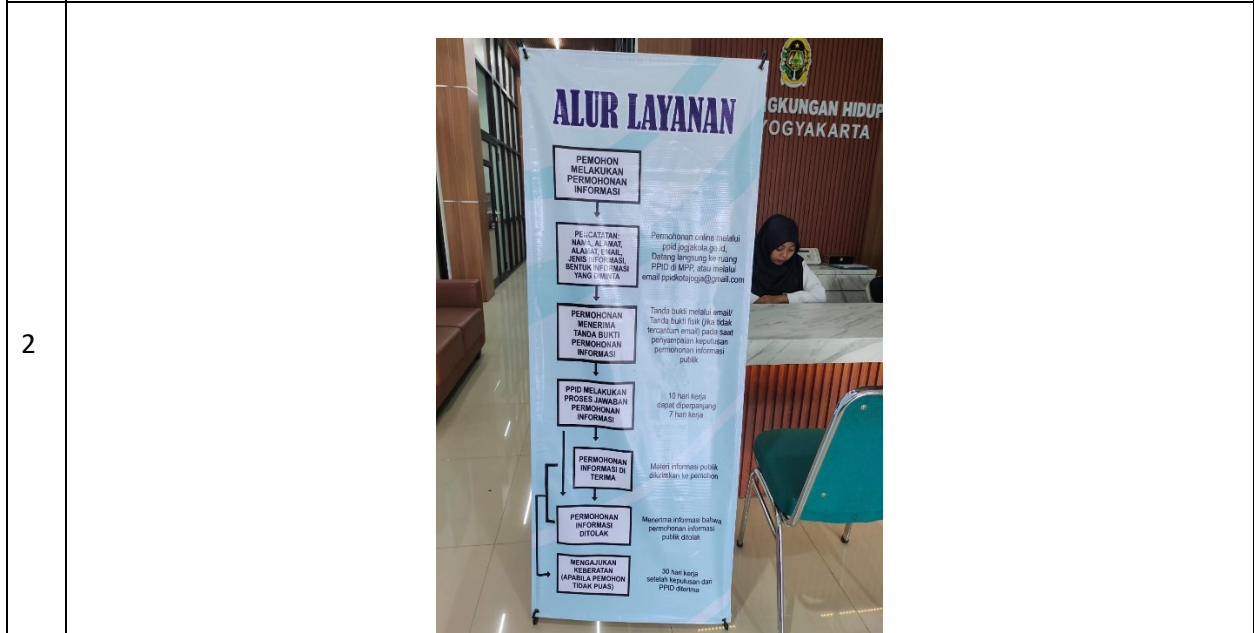
Caption : Alur Layanan / keberatan Informasi