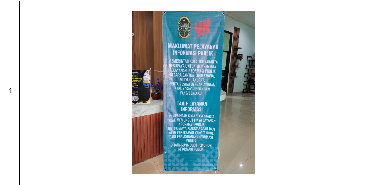
Caption : Maklumat Layanan Informasi