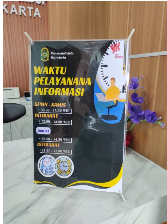
Caption : Jadwal Layanan