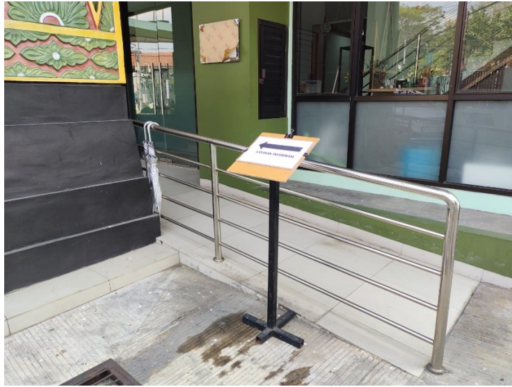
Caption : Dilengkapi jalur kursi roda / guiding block